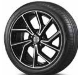
Jante aliaj 18"

Mostrele de culoare prezentate pot varia ușor față de realitate, din cauza condițiilor de iluminare și a procesului de tipărire. Pentru informații complete cu privire la disponibilitatea culorilor și a tapițeriei, vă rugăm să contactați distribuitorii Hyundai Auto România.