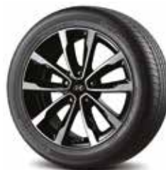
Jante aliaj 17"