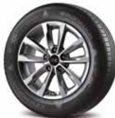
Jante aliaj 16"