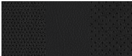
Tapițerie piele - Negru