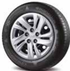
Jante oțel 16"