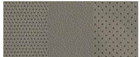
Tapițerie piele - Bej